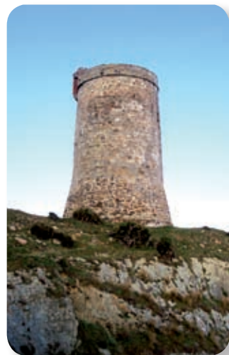
La torre de Guadalmesí tuvo como misión la defensa del único punto de abastecimiento posible de agua que se mantenía durante todo el año.

Nuestro itinerario se inicia en el área recreativa El Bujeo (ver [1] en el mapa). La pista forestal que parte a nuestra izquierda nos lleva por la ladera de la sierra desde la que disfrutaremos de las vistas de la cuenca del Guadalmesí y, en días claros, del estrecho de Gibraltar [2], del que emerge en su otra orilla el pico Yebel Musa, con sus más de ochocientos metros, aún más cercano desde la desembocadura del río, con su torre vigía y el observatorio de aves. Aunque nuestro sendero no nos lleva tan lejos.