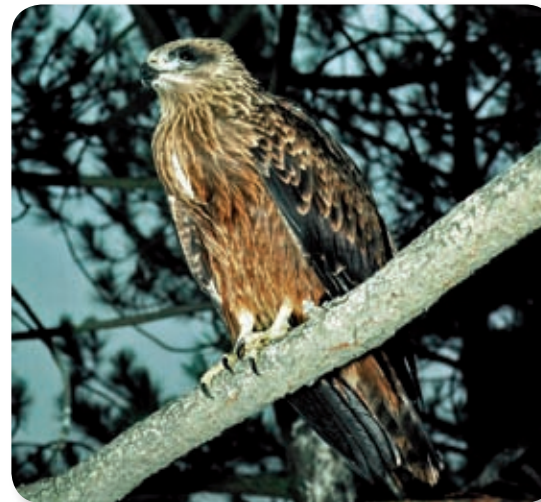
El mecanismo de vuelo de las aves planeadoras consiste en aprovechar las corrientes de aire ascendente para tomar altura y planear con un gasto energético mínimo. La ausencia de estas corrientes en el mar les obliga a buscar los pasos más estrechos entre el continente europeo y el africano: el de Gibraltar y el del Bósforo. La espera de condiciones favorables para la travesía llega a reunir en esta zona gran número de aves, llegándose a contabilizar hasta tres mil milanos negros en un sólo día (como el ejemplar joven de la fotografía).

Abandonaremos la pista forestal justo antes de cruzar el puente para tomar una vereda que nos adentra en los canutos [4], oasis y refugios de especies ya desaparecidas del resto del continente europeo. Después, no pasarán inadvertidos a nuestros ojos los colores y texturas de la vegetación, cambiante según la estación del año, o el lugar donde encuentran sus mejores condiciones: alisos y quejigos de verde brillante en verano contrastan con el verde apagado de los alcornoques en las laderas; mientras en invierno las ramas desnudas de los árboles, cerca del agua, lo hacen con el verde oscuro de los chaparros, más arriba.